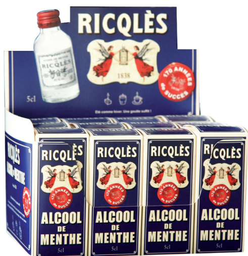
Packaging RICQLÈS pour bouteilles d'alcool de menthe.

Le packaging représente 10 % de notre production. Nos techniques de fabrication nous permettent de réaliser ces produits de plus en plus demandés. Supports papiers, cartons, plastiques, avec ou sans vernis 100 % ou sélectif, découpe, gaufrage, dorure, flocage. Nos presses permettent de passer de nombreux supports épais et notre savoir faire permet toutes finitions.