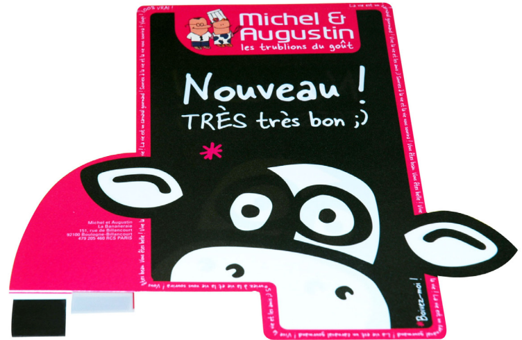
PLV MICHEL ET AUGUSTIN pour la vache à boire.

Nous nous appliquons à maîtriser ces nouvelles réalisations en plus de notre éventail de savoir faire.